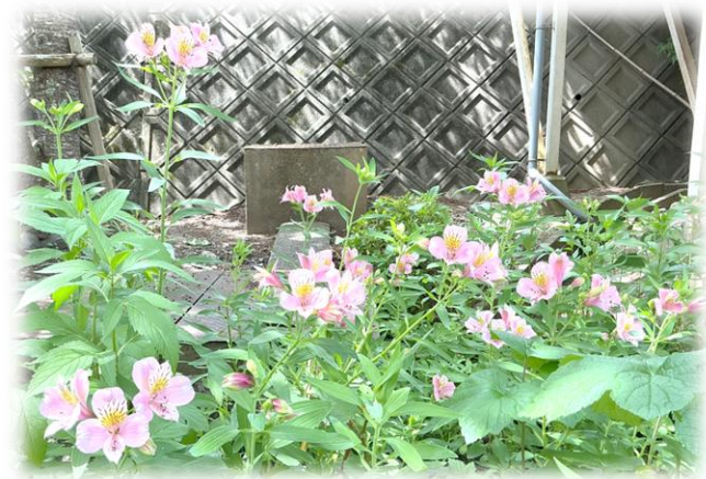
裏庭では、アルストロメリアが美しく咲いています。